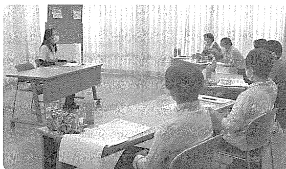
認知症とちょこボラについての講義の様子 皆さん真剣に聞いています