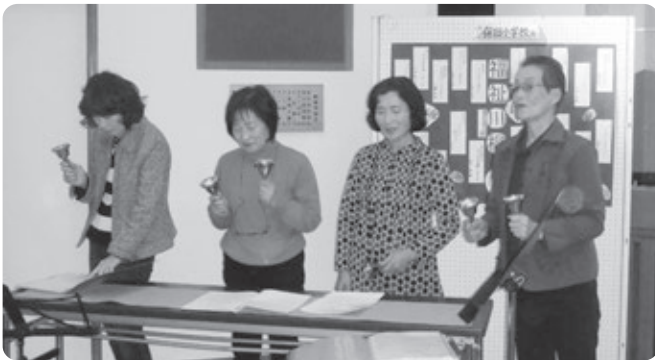
ハンドベルのグループ『フェアリー』

参加者は年々増え、5回目を数える今回は、およそ170名の方が会場を訪れ、ステージ発表や活動紹介ブースを見学、体験し、楽しい一時を過ごしました。