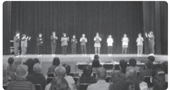
手話で『サザエさん』を歌いました