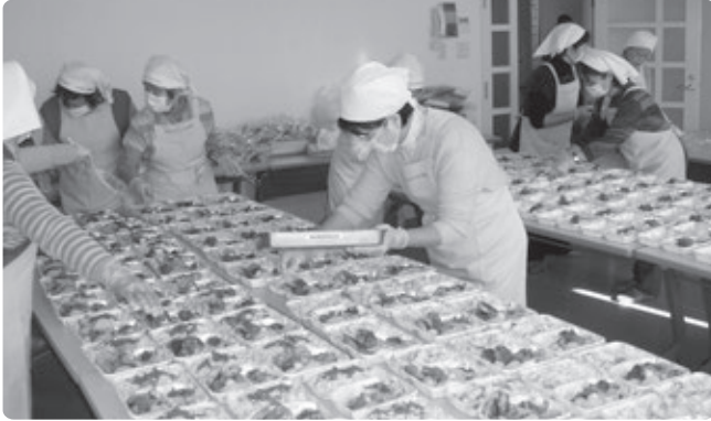
お弁当を作る食生活改善協議会